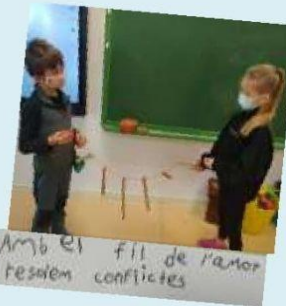
Amb el fil de l'amor resolem conflictes