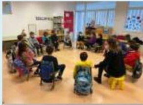
RESPECTAM EL TURN DE PARLADA.

Una sessió a la setmana els fillets i filletes de 1r i 2n realitzem una assemblea que ens serveix per facilitar la participació dels alumnes en la vida de l'aula i del centre i per ajudar a aprendre a participar en un marc de respecte i convivència.