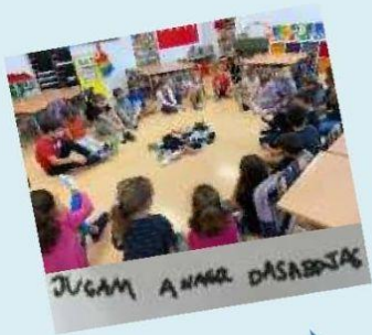
JUGAM A NARRAR DASABONJAS

Algunes vegades durant l'assemblea fem cercles restauratius: és una metodologia que vol posar l'accent en la comunitat, en la reconstrucció de relacions, en la responsabilitat i en la confiança.