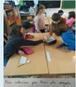
Ens escoltem per tractar els dubtes.

Per fer-ho disposem les cadires de l'aula en rollana per tal de facilitar la conversa, així ens podem veure i escoltar millor, i per ser conscients que es tracta d'un moment molt important.