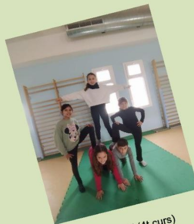
"Acrosport" (4t curs)

Fins aquí la nostra aportació, esperem que us hagi agradat!