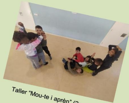
Taller "Mou-te i aprèn" (2n curs)

Per altra banda, els cursos de 3r a 6è hem treballat l'Acrosport, activitat que no s'havia treballat aquests darrers anys. L'Acrosport és un esport col·lectiu que implica realitzar construccions humanes que reben el nom de piràmides o figures. Segons el curs on es treballava aquest esport, la complexitat d'aquestes construccions era menor o major. S'han fet des de figures en parelles fins a figures de 5 alumnes.