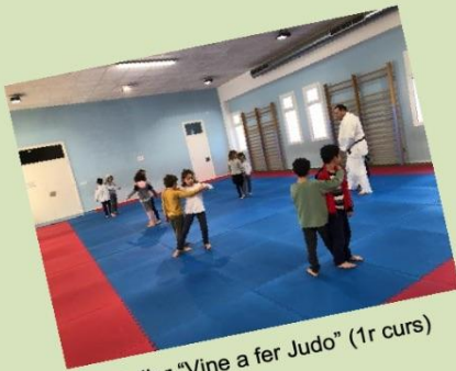
Taller "Vine a fer Judo" (1r curs)

Per una banda, els cursos de primer van fer un taller d'iniciació al Judo a través del programa Salut Jove del Consell Insular, l'alumnat s'ho va passar molt bé aprenent un esport que molts i moltes no coneixien. Mitjançant Salut Jove també, els cursos de 1r i 2n curs van realitzar el taller de "Mou-te i aprèn", on l'alumnat va xalar molt treballant l'expressió corporal.