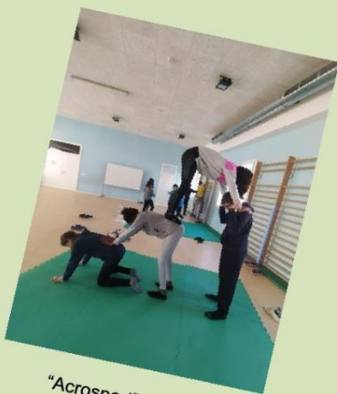
"Acrosport" (6è curs)

Per altra banda, els cursos de 3r a 6è hem treballat l'Acrosport, activitat que no s'havia treballat aquests darrers anys. L'Acrosport és un esport col·lectiu que implica realitzar construccions humanes que reben el nom de piràmides o figures. Segons el curs on es treballava aquest esport, la complexitat d'aquestes construccions era menor o major. S'han fet des de figures en parelles fins a figures de 5 alumnes.