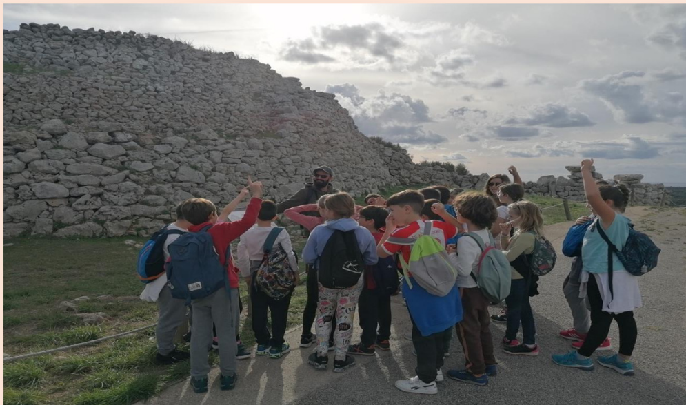
Fillets i filletes de 4t

Aquesta sortida ens va servir per aprendre moltes coses, a la vegada que ens ho vam passar molt bé. Després de la sortida, a classe i amb el plànol del poblat de la torre d'en Galmés, vam fer una activitat d'esbrinar el nom dels edificis.